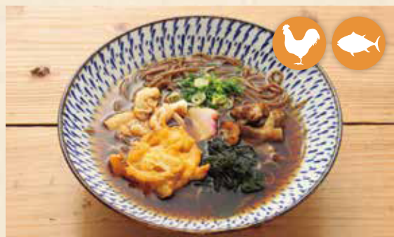
08 荞麦面条 蕎麥麵 메밀 국수 ¥880 そば 어린이에게도 인기. 불륨 만점. (카레 메뉴의 루(roux)는 모두 비프카레가 베이스입니다.) (카레 메뉴의 루(roux)는 모두 비프카레가 베이스입니다.)