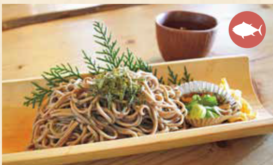
09 Zaru Soba (buckwheat noodles served on a bamboo tray) ざるそば ¥720