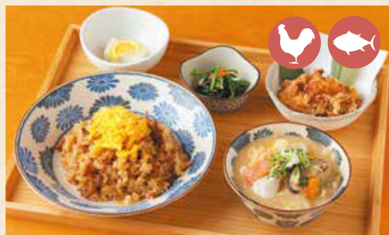
10 Jidori-meshi set (seasoned local chicken and rice set) とりめしセット ¥1,430

Popular with children. Super size. (All roux on the curry menu is based on beef curry) 子どもにも人気。ボリューム満点。 (カレーメニューのルーは全てビーフカレーがベースです)