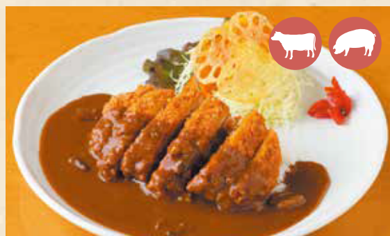
02 Pork cutlet curry カツカレーライス ¥990