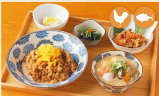
10 本地鸡鸡肉饭套餐 放山雞炊飯套餐 토종닭 밥 세트 ¥1,430 地どりめしセット

餐也很受儿童欢迎。份量足。(本店的咖喱都是牛肉咖喱为基底) 小孩都喜欢。份量满点。(咖喱菜单所使用之咖喱酱汁皆为牛肉基底) 어린이에게도 인기. 불륨 만점. (카레 메뉴의 루(roux)는 모두 비프카레가 베이스입니다.) (카레 메뉴의 루(roux)는 모두 비프카레가 베이스입니다.)