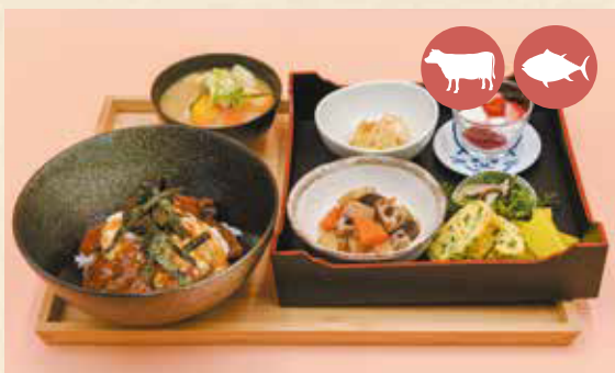
05 Aka-ushi beef set meal (Japanese brown cattle beef) あか牛定食 ¥1,980