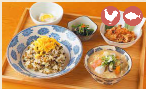
06 Takana meshi (mustard leaf fried rice) set たかなめしセット ¥1,430