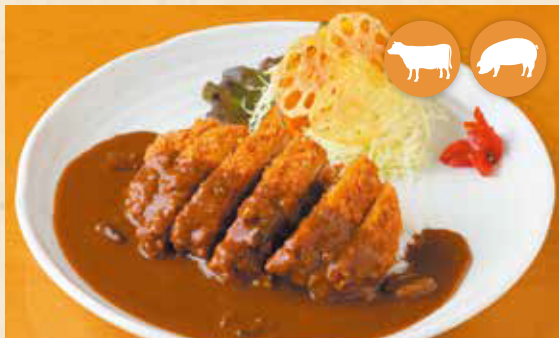
02 炸猪排咖喱 炸肉排咖喱 돈가스 카레 ¥990 카츠カレーライス