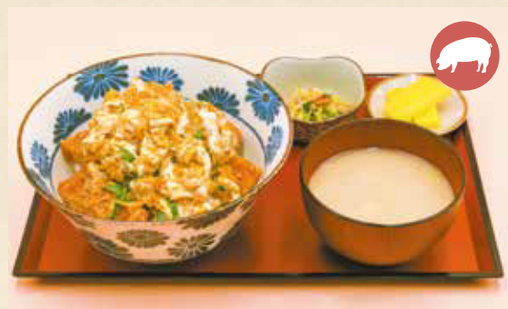
07 Katsu-don (pork cutlet, egg and rice bowl) カツ丼 ¥990