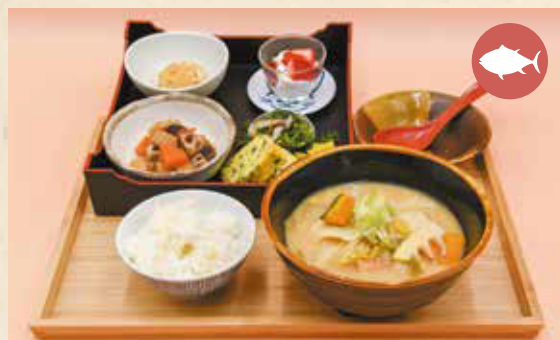
04 Dangojiru (dumpling soup) set だんご汁定食 ¥1,430