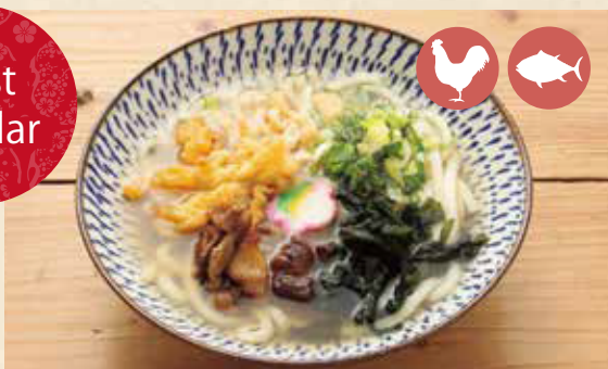
01 Udon Noodle うどん ¥880