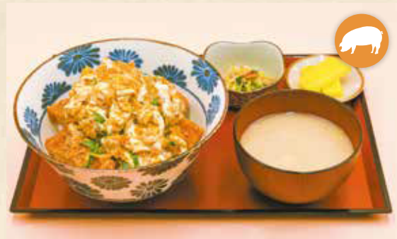
07 炸猪排盖饭 炸肉排蓋飯 돈가스 덮밥 ¥990 카츠丼