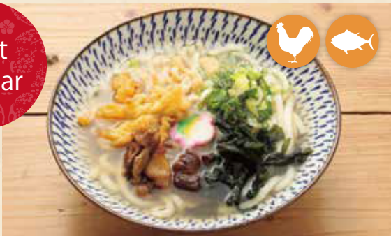
01 乌冬 烏冬 우동 ¥880 うどん