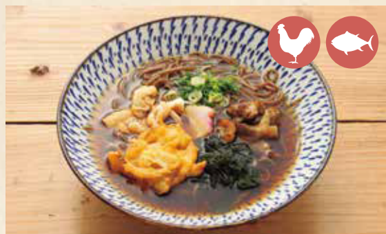
08 Soba buckwheat noodle そば ¥880