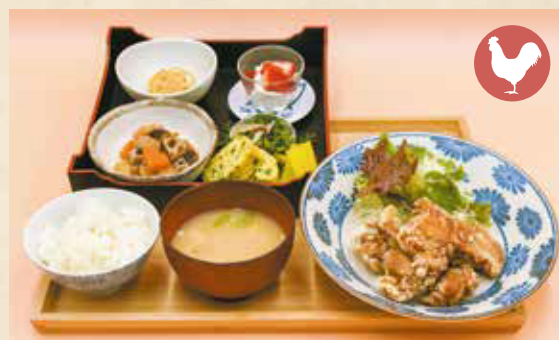
03 Fried chicken set からあげ定食 ¥1,430